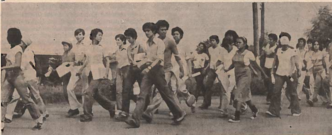
La jeunesse a une autre responsabilité historique: «Prendre l'offensive dans cette seconde bataille de libération nationale.» Elle est aussi importante que celle de vaincre Somoza: «Sortir le peuple de son 50% et plus d'analphabétisme.»

Quand tu vois ce signe, souvient toi que tu as un engagement envers le peuple du Nicaragua: «Enseigner à lire et à écrire à un frère.»