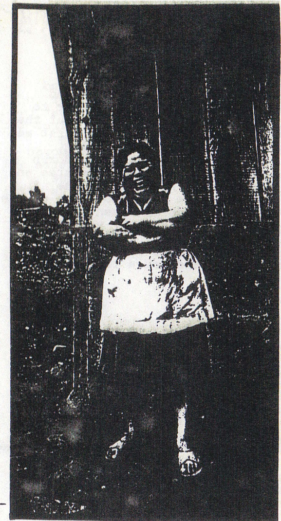
from In the Village, by Jonathan Leaning